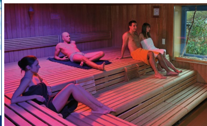
Die Saunalandschaft im GalaxSea besteht aus sechs verschiedenen Saunen.