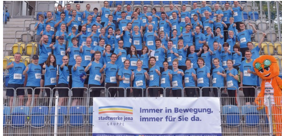
Beim 6. Jenaer Firmenlauf waren fast 100 Mitarbeiter der Stadtwerke Jena Gruppe mit am Start. Gemeinsames Motto: Immer in Bewegung – immer für Sie da.