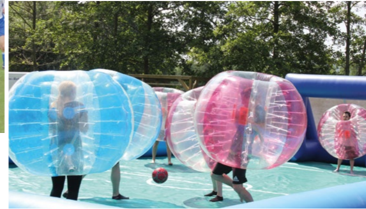
Beim 2. Azubi-Fit-Tag am Strandschleicher waren über 70 Azubis dabei. Neben Spaß an Bewegung stand gegenseitiges Kennenlernen im Fokus.