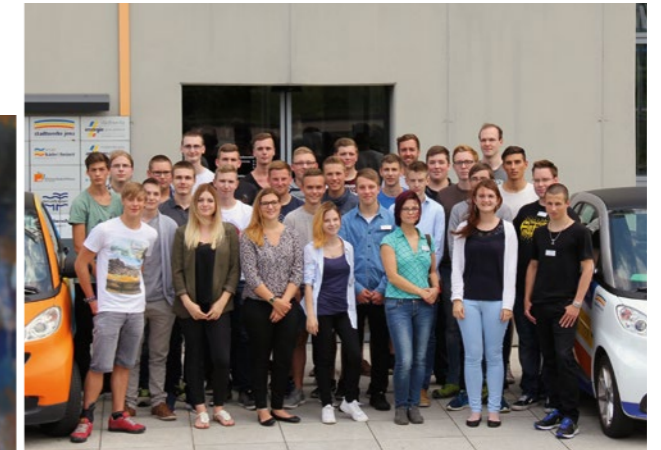
31 neue Azubis starteten 2016 in der Stadtwerke Jena Gruppe.

»Fit in Führung‘ beleuchtet unterschiedlichste Führungssituationen. Ich habe trotz einiger Jahre Erfahrung als Teamleiter viel dazu gelernt . Besonders die Vernetzung zwischen den Teilnehmern aus den verschiedenen Unternehmen der Stadtwerke Jena Gruppe ist sehr wertvoll. Ein Muss für jede Führungskraft!«