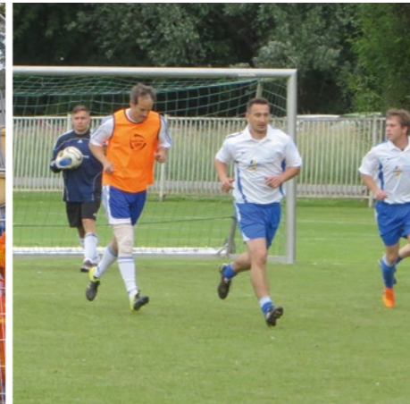
Schöne Tradition: Beim Fußballcup der Stadtwerke Jena Gruppe kämpften 2016 fünf Mannschaften um den Wanderpokal.