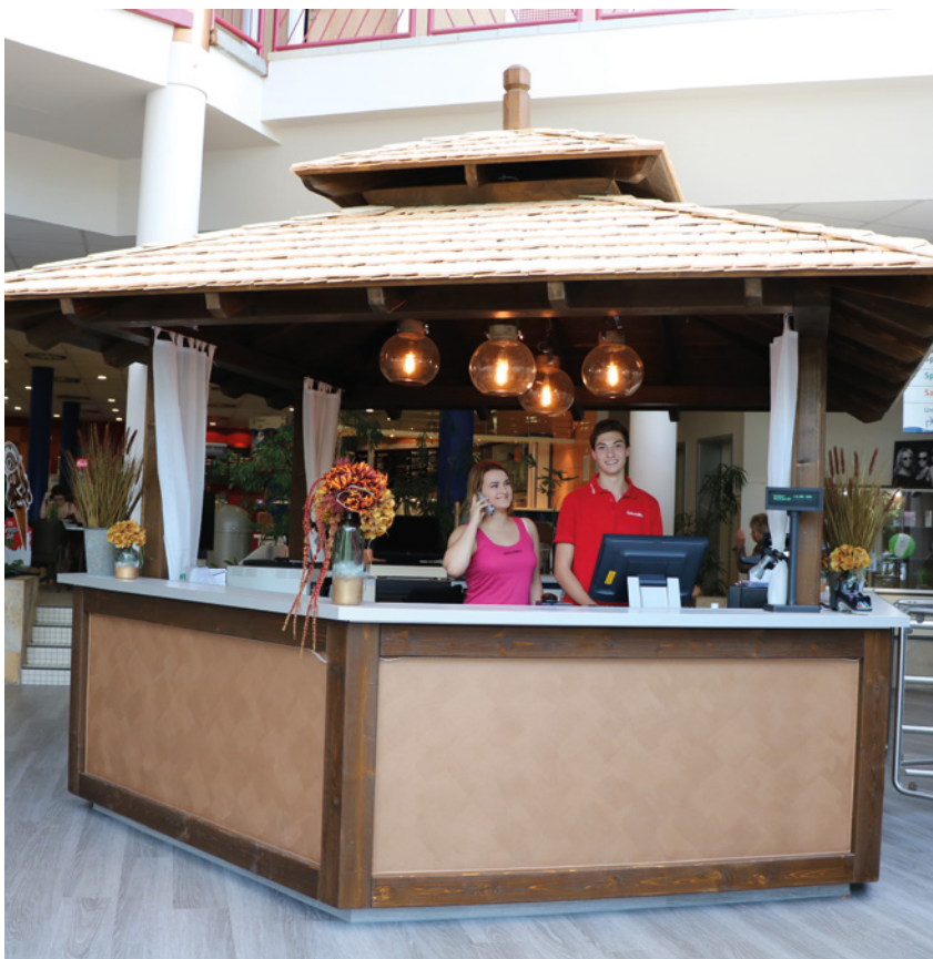
Im Foyer des GalaxSea fanden erste Umbauarbeiten statt, die 2018 weiter fortgeführt werden.

Die guten Zahlen spiegelten sich auch bei den Saunagästen und Kursbesuchern wieder. Fast 58.000 Besucher schwitzten in der Saison 2017 in der 5-Sterne-Saunalandschaft, insgesamt 611 Kinder lernten in dieser Zeit im GalaxSea in verschiedenen Kursen das Schwimmen.